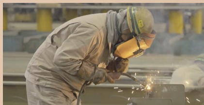
船の部品を組み立てるようす