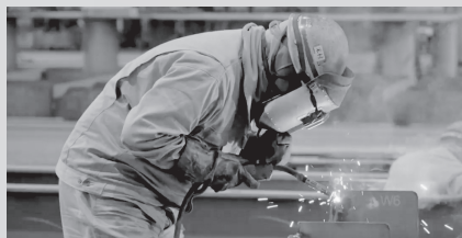
船の部品を組み立てるようす