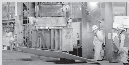
船の部品を折りまげるようす

船づくりは、 【選びぬかれた10人・300人・2,000人】 の人が かわり、約3年の時間と10万点以上の部品を必要 とする超巨大プロジェクトです。