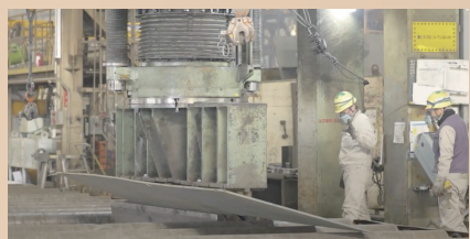
船の部品を折りまげるようす

船づくりは、 { 選びぬかれた10人・300人・2,000人 } の人が かわり、約3年の時間と10万点以上の部品を必要とする超巨大プロジェクトです。